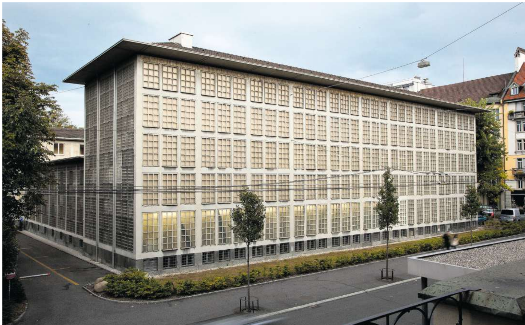
Schweizer Bibliotheken: Nachdem ihr kurz der Abriss gedroht hat, schaut die Zentral- und Hochschulbibliothek Luzern, ein 1951 von Otto Dreyer realisiertes Juwel der Nachkriegsmoderne, optimistisch in die Zukunft, wird sie doch derzeit von Lussi + Halter renoviert und dabei das abgebildete Büchermagazin in einen neuen Freihandbereich umgewandelt.